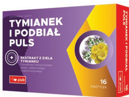
TYMIANEK PODBIAŁ PULS 16 pastylek

Suplement diety • Pastyłki, 16 sztuk • Skład: cukier, syrop glukozowy, ekstrakt z ziela tymianku Thymus vulgaris , ekstrakt z liści podbiału Tussilago farfara L., regulator kwasowości (kwas cytrynowy), kwas L-askorbinowy (witamina C), mentol, aromat eukaliptusowy, aromat anyżowy. Głównymi składnikami suplementu diety Tymianek i Podbiał Puls są ekstrakty roślinne - z ziela tymianku i liści podbiału oraz witamina C i mentol. Ekstrakt z ziela tymianku pomaga w prawidłowym funkcjonowaniu układu oddechowego. Dodatkowo ekstrakt z ziela tymianku i witamina C wspierają prawidłowe funkcjonowanie układu odpornościowego.