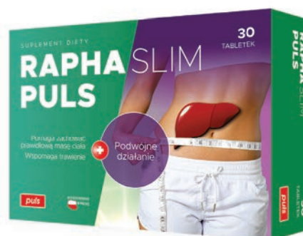
RAPHASLIM PULS 30 tabletek

Suplement diety • Tabletki, 30 sztuk • Raphaslim Puls zawiera składniki wspomagające utrzymanie zdrowej wątroby oraz zachowanie prawidłowej masy ciała i prawidłowego trawienia. • Składniki: substancja wypełniająca: celuloza mikrokryształiczna; L-asparaginian L-ornityny; ekstrakt z kopru włoskiego; cholina; ekstrakt z karczocha; ekstrakt z liści ostrokrzewu paragwajskiego; ekstrakt z korzenia cykorii; ekstrakt z ostrzyżu długiego; substancje przeciwzbrylające: stearynian magnezu, dwutlenek krzemu. • Przeznaczenie: preparat przeznaczony jest dla osób dorosłych. Opakowanie zawiera 3 blister po 10 tabletek.