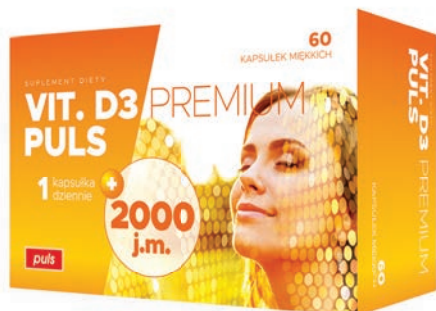
VIT. D3 PREMIUM PULS 2000 j.m., 60 kapsułek

Suplement diety • Kapsułki, 60 sztuk • Witamina na oleju roślinnym (słonecznikowym), wspomaga w utrzymaniu zdrowych kości i zębów, pomaga w prawidłowym funkcjonowaniu układu odpornościowego. Witamina D: - pomaga w utrzymaniu zdrowych kości, - pomaga w prawidłowym wchłanianiu wapnia i fosforu, - pomaga w utrzymaniu prawidłowego poziomu wapnia we krwi, - pomaga w utrzymaniu zdrowych zębów, - pomaga w prawidłowym funkcjonowaniu układu odpornościowego, - bierze udział w procesie podziału komórek.